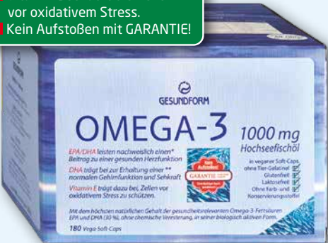
Gesundform Omega-3 1000 mg Hochseefischöl 180 Vega-Soft-Caps