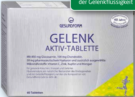
Gesundform Gelenk 850 mg 60 Tabletten