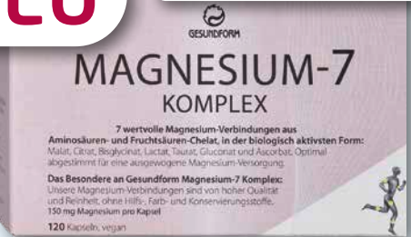
Gesundform Magnesium-7 Komplex 120 Vega-Caps