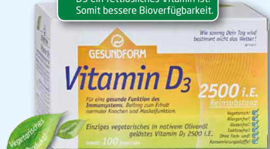
Gesundform Vitamin D 3 2500 i.E. 100 Vega-Caps