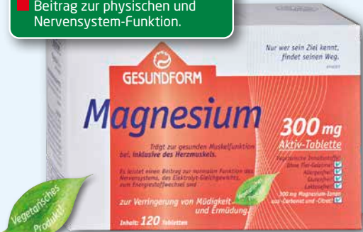
Gesundform Magnesium 300 mg 120 Aktiv-Tabletten